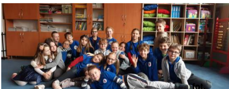
Redakcja pierwszego numeru - klasa 3C M.G.

Zamknij na chwilę oczy... wsłuchaj się mocno... w oddali słychać dźwięk werbli, tuż nad Twoją głową przelatuje niesiona przez wiatr delikatna muzyka skrzypiec. Posłuchaj teraz tego co dobiega z lewej strony, lśniący w słońcu saksofon delikatnie i cichutko gra kolejne dźwięki, by po chwili wiatr poniosł je ku górze. Twoje policzki coraz mocniej rozgrzewa muzyka, Twoje serce zaczyna bić w tym samym rytmie co niesiona przez wiatr melodia.